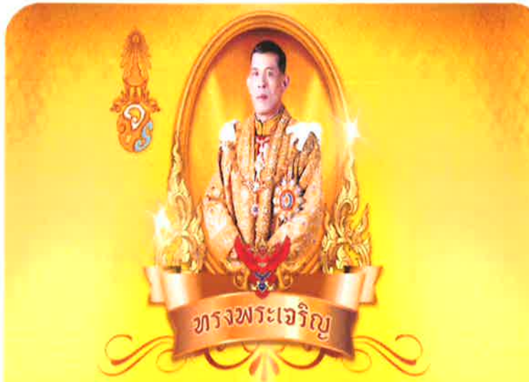
สมเด็จพระเจ้าอยู่หัวมหาวชิราลงกรณ บดินทรเทพยวรางกูร รัชกาลที่ ๑๐